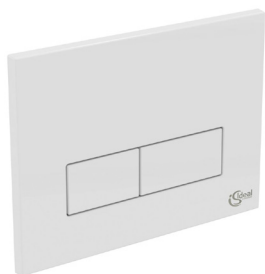
Ovládací deska – bílá výrobce: Ideal Standard typ/model: Ideal Systems označení/kod: W3708AC