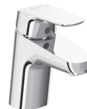
Umyvadlová baterie (5 l/min) výrobce: Ideal Standard typ/model: CeraFlex označení/kód: B1710AA