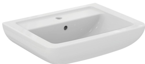
Umyvadlo 60 cm výrobce: Ideal Standard typ/model: Eurovit Plus označení/kód: V302701