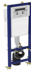
Vestavný modul pro závěsné klozety, kotvení do stěny výrobce: Ideal Standard typ/model: Ideal Systems označení/kod: W370567