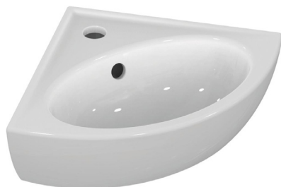
Rohové umývatko 33,5 x 33,5 cm výrobce: Ideal Standard typ/model: Eurovit označení/kód: V220201