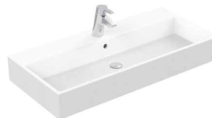
Nábytkové umyvadlo, 91x42cm výrobce: Ideal Standard typ/model: Strada označení/kód: K078601