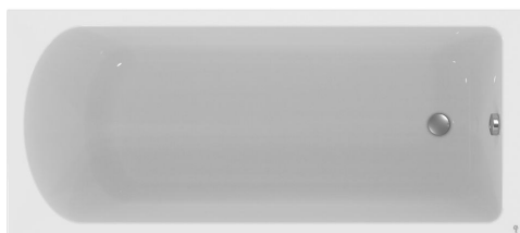
Vana 170 x 75 cm výrobce: Ideal Standard typ/model: Hotline New označení/kód: K274601