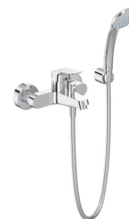
Vanová baterie nástěnná se sprch. příslušenstvím výrobce: Ideal Standard typ/model: CeraFlex označení/kód: B1722AA